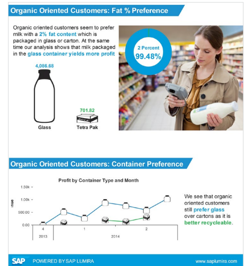
Figure 2 : Infographie pour SAP Lumira®